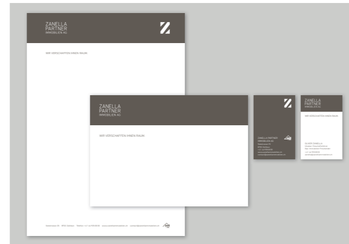
Briefschaff Briefpapier, Notizkarte, Visitenkarten