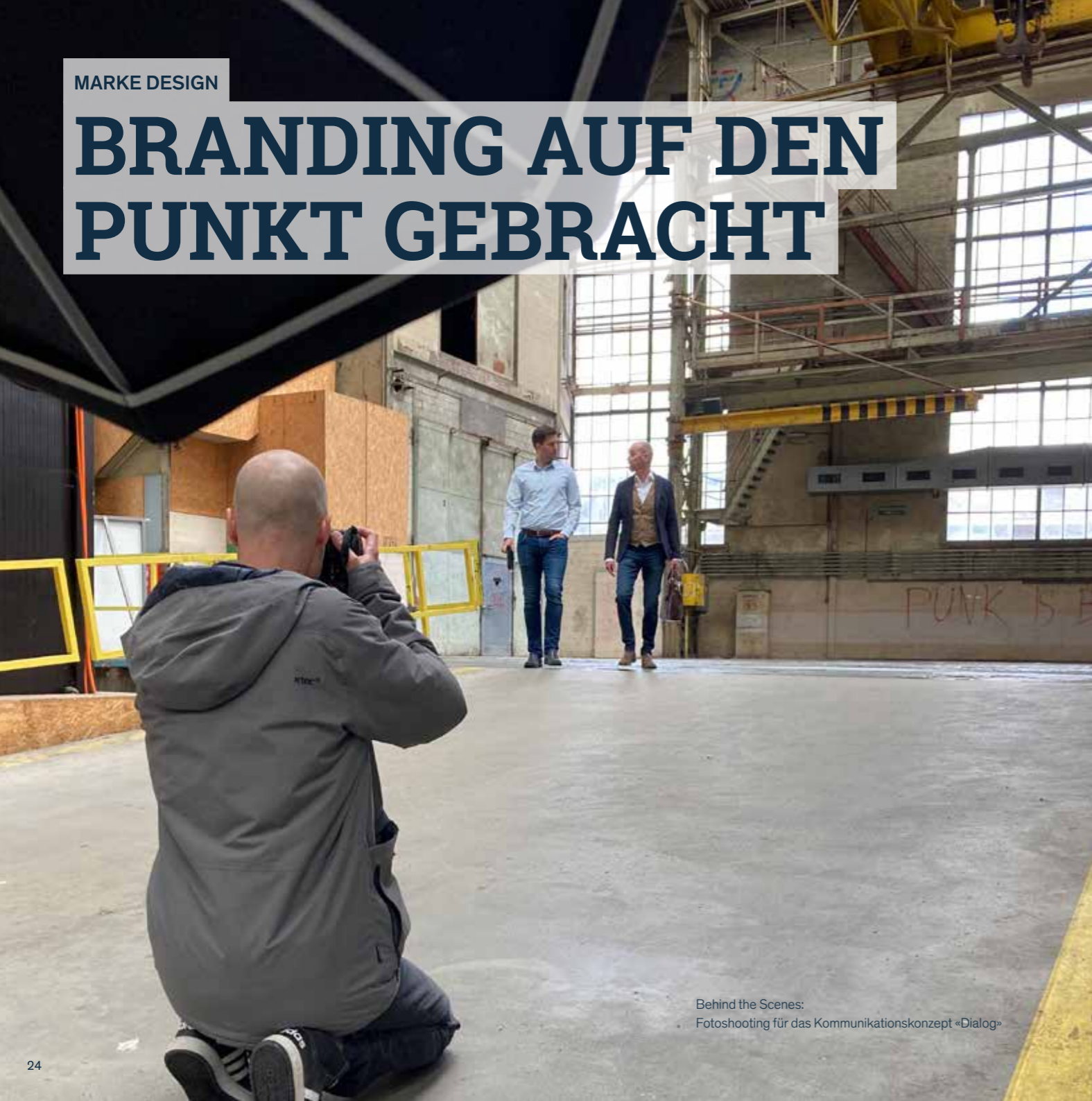
Behind the Scenes: Fotoshooting für das Kommunikationskonzept «Dialog»

Das Baumanagement-Unternehmen Biedermann + Frey hat Felix Partner Design mit der Erarbeitung eines umfassenden Kommunikationskonzepts beauftragt. Abgestimmt auf die Kernwerte – die Persönlichkeit des Unternehmens – entwickelten die Brandingspezialisten von der Corporate Identity über das Corporate Design bis zum entsprechenden Massnahmenplan einen kompletten Firmenauftritt für das Start-up-Unternehmen.