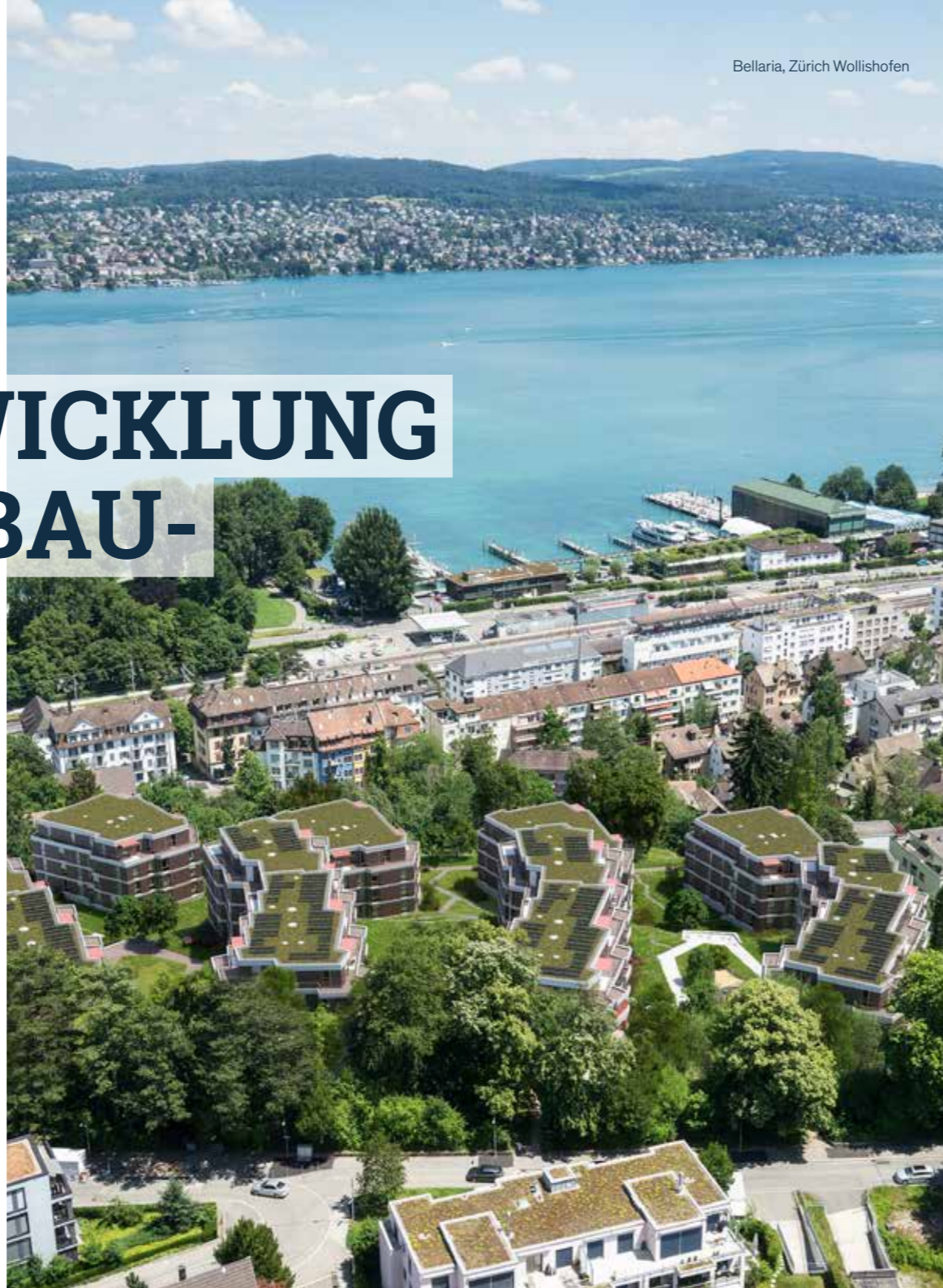
Bellaria, Zürich Wollishofen